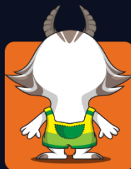
Horn: 01 Body: 03 Clothes: 043

۳. سطح سخت: در این سطح هم همانند آلبوم‌های قبلی باید پیکسی‌ای با مشخصات تعیین شده داشته باشید، با این تفاوت که تنها یک جای خالی دارد که سه مورد از اعضای یک پیکسی در آن مشخص شده است و برای پر کردن آن باید پیکسی‌ای با مشخصات تعیین شده داشته باشید.