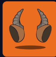
Horn: 01 Ears: 068

۳. سطح سخت: در این سطح هم همانند آلبوم‌های قبلی باید پیکسی‌ای با مشخصات تعیین شده داشته باشید، با این تفاوت که تنها یک جای خالی دارد که سه مورد از اعضای یک پیکسی در آن مشخص شده است و برای پر کردن آن باید پیکسی‌ای با مشخصات تعیین شده داشته باشید.