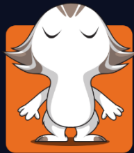
Body: 03 Eyes: 041

۲. سطح متوسط: در سطح متوسط نیز مانند سطح آسان سه جای خالی مشخص شده است که برای پر کردن هر یک از آن‌ها باید پیکسی‌ای با آن مشخصات داشته باشید با این تفاوت که در هر جای خالی، دو نوع از اعضای بدن هر پیکسی تعیین شده است.